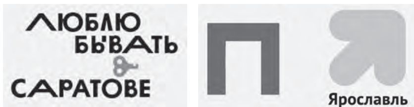
Рис. 2. Логотипы Саратова, Перми и Ярославля

ченный стиль, повторяя худшие западные унифицированные образцы брендингования в стиле примитивизма. В результате некоторые российские города в процессе имиджевых кампаний получили новые конструктивистские примитивные логотипы, которые полностью лишены культурных и исторических ассоциаций, что справедливо вызывает возмущение жителей региона и профессиональных экспертов (рис. 2) 1 .